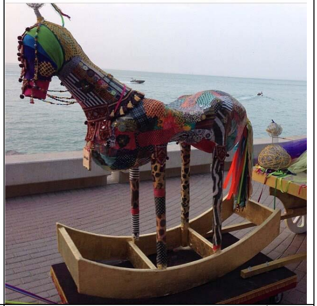
من أبداعات مدرسة الوهيب كرنفال فننازيا حولي مدرسة مريم بنت صالح المتوسطة