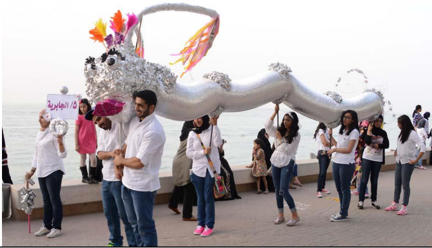
إبداعات ثانوية الجابرية بنات