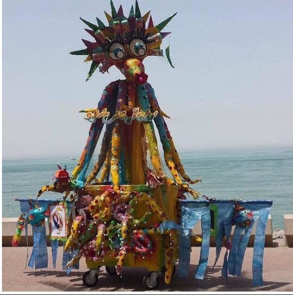
وحش حولي من مدرسة عمرة بنت مسعود الابتدائية كرنفال فنتازيا حولي مدرسة مريم بنت صالح المتوسطة