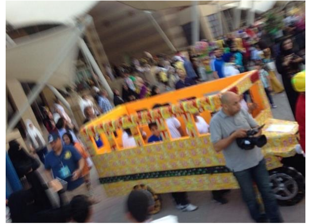
من أبداعات مدرسة خباب بن الأثرث