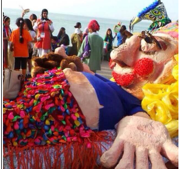
مجسم ابداعى لثانوية الجوبرية بنات