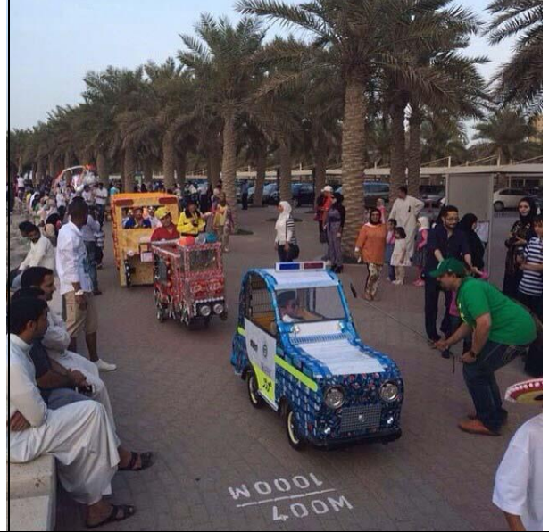
من أبداعات مدرسة خباب كرنفال فنتازيا حولي مدرسة مريم بنت صالح المتوسطة