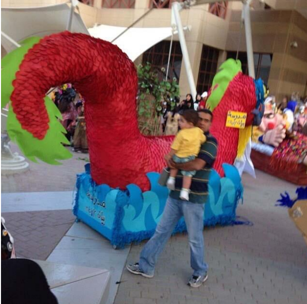
مجسم ابداعى لبيان المتوسطة كرنفال فنتازيا حولي مدرسة مريم بنت صالح المتوسطة