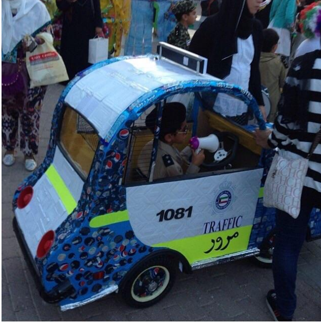
من ابداعات دورية مدرسة خباب الابتدائية