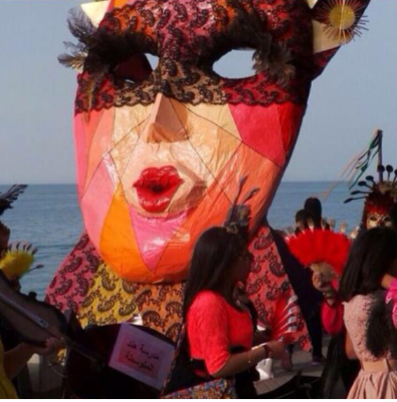
من ابداعات مدرسة هند المتوسطة